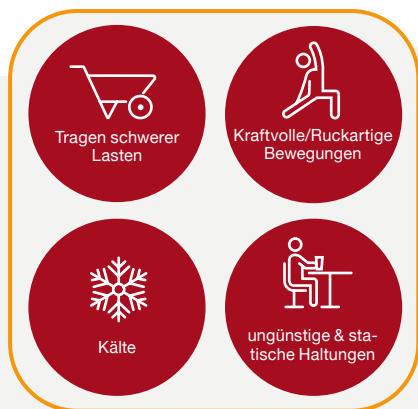
physisch und biomechanisch

Die Risikofaktoren für die Entstehung von Muskel-Skelett-Erkrankungen sind vielfältig. Sie lassen sich grundsätzlich in physische und biomechanische, organisatorische und psychosoziale sowie individuelle Risikofaktoren unterscheiden.